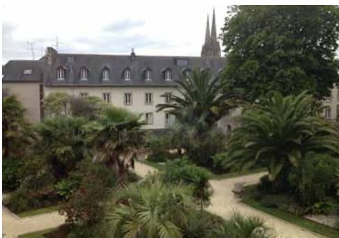
Jardin de la Retraite à Quimper

Pour plus d'information sur le Concours Départemental des Villes et Villages Fleuris : www.deux-sevres.com .